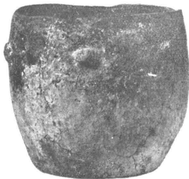
Fig. 2. — Ulică din m. 16.

S XIX, la sud de S XIII, ne-a dat în caroul 3 o situație nu tocmai clară. În pămîntul castaniu închis, la -0,30 m, s-au întîlnit două vase de factură locală, deranjate; oala din pastă roșcată, cu pereții groși, lustruiți, cu apucători ovale oblice în sus, era răsturnată cu gura în jos, iar partea dinspre fund lipsă; alături, fragmentele unei strachini din pastă curată cenușiu-castanie, cu buza înălțată și cu suport inelar pe fund. Dedesubtul acestora, în pămîntul galben, antic, era înfiptă partea de jos a unei amfore elenistice, din pastă roșcată, cu mica, și