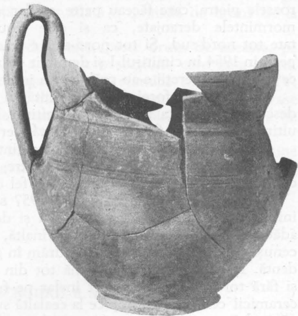
Fig. 3. — Urna din m. 22.

Cele nouă morminte descoperite anul acesta, fac, pe de o parte, să se îmbogățească repertoriul formelor ceramice de factură locală, iar pe de altă parte prezintă unele situații clare, care completează informațiile de pînă acum, cu privire la ritul de înmormîntare 1 .